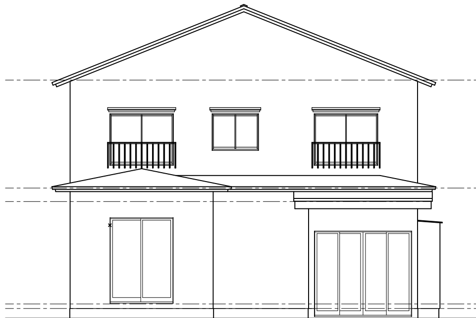
西側立面図 1 / 100